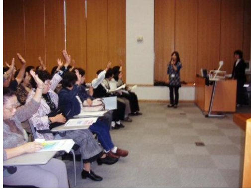
学生時代に戻った気分で「からだ館」 致道ライブラリーで健康について学びました