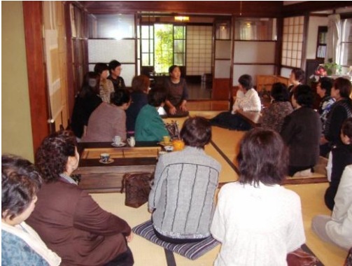
知憩軒「おもてなしの心」講話

研修だけでなく、今回は朝日支部の部員も参加しており、懇親を深めるという意味でも大変有意義な視察でした。