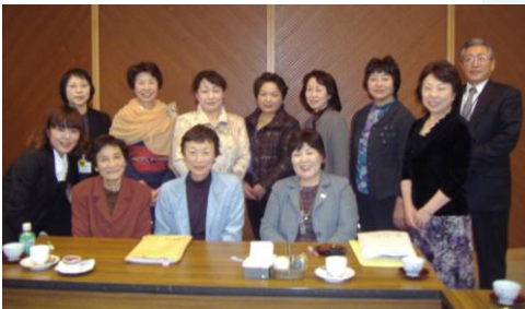
またいつか再会しようねと記念写真をバチリ