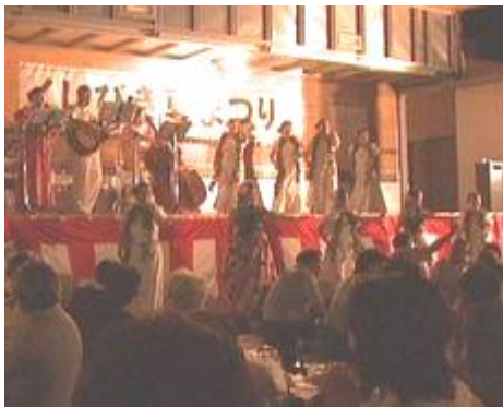
7月18日開催くしびぎ夏まつり

地域を取り巻く環境が変化し厳しさが続く最中、地域経済の活性化・地域振興の為に頑張っている住民・事業者・従業員、そして家族の皆さんが一同に会して、情報交換・相互親睦を深め合い、今後の地域事業活動の糧にすることを目的に、去る七月十八日（日）櫛引商工会館駐車場を会場に、櫛引観光協会と出羽商工会櫛引支所の共催イベントとして『くしびぎ夏まつり』が盛大に開催されました。