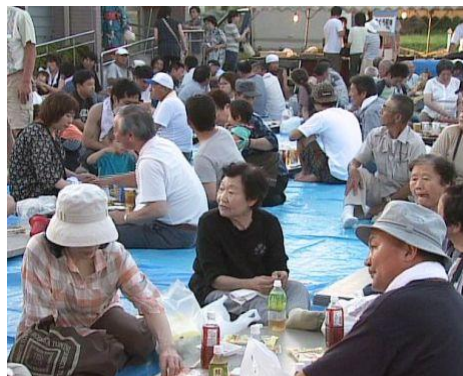
7月18日開催くしびぎ夏まつり