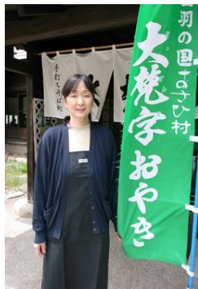
(株)月山あさひ博物村『そば処大梵字』