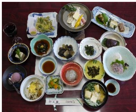
さと山春の御膳(2,500円)

昨年より参加店も三支部(羽黒・榊引・朝日)合同事業となり、お客様にも選択肢が広がり楽しみも増えていると感じています。商工会が二年前に合併して、その相乗効果も発揮されつつあります。地元だけでなく、出羽商工会エリアの名物御膳としてPRして参りたいと思