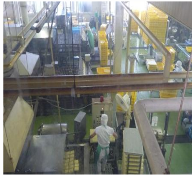
豆腐工場「住吉屋食品」

会社の敷地や工場の規模の大きさに皆びっくり！工場見学には社長はじめ、社員の丁寧な説明がありました。試食のできるお店も敷地内に併設されており、他のお客様がびっくりするほど部員が買い物をし、最初からバスのトランクがいっぱいになりました。