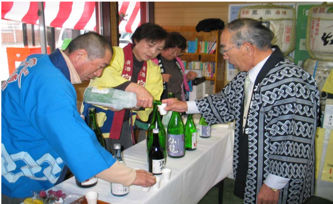
第14回大山新酒・酒蔵まつりの模様