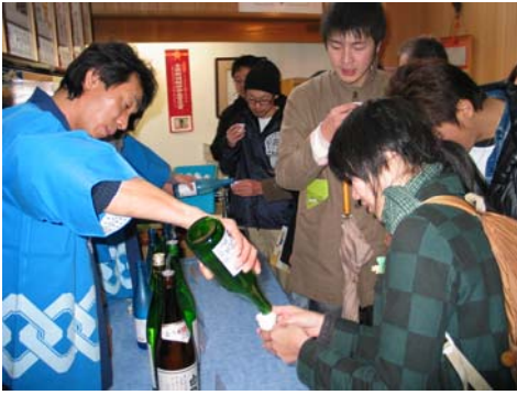
第14回大山新酒・酒蔵まつりの模様

伝 統の酒蔵で美味しい新酒を楽しんでいただく恒例イベント「大山新酒・酒蔵まつり」が二月十三日(土)、大山地区内四軒の酒蔵を中心に開催されます。十五回の節目を迎える今年は、例年以上の斬新な企画をご用意しておりますので、是非ご参加下さい。