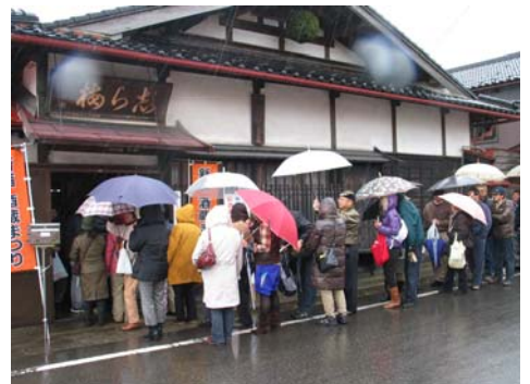
第14回大山新酒・酒蔵まつりの模様

日時/2月28日(日)10:00~15:00 会場/湯殿山スキー場内特設会場 内容/あつあつの鍋や屋台フードなどおいしいものいっぱい! 冬を満喫しよう!