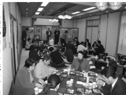
鼠ヶ関地区での発表会

実施にあたっては朝日支部が山菜やきのこの塩蔵乾物といった冬季の保存食を中心とした山村の食の技、温海支部が温泉での癒しのひと時と旬の魚料理というようなコンセプトを設定し