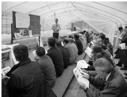
窪畑ファームでの現地研修