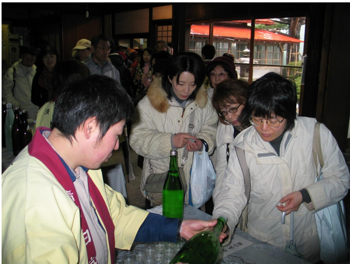
第14回大山新酒・酒蔵まつり